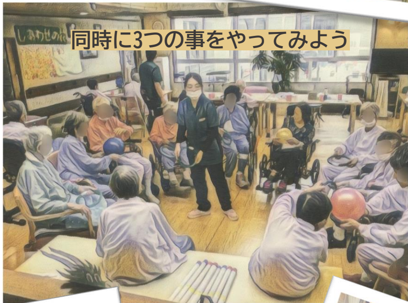
同時に3つの事をやってみよう