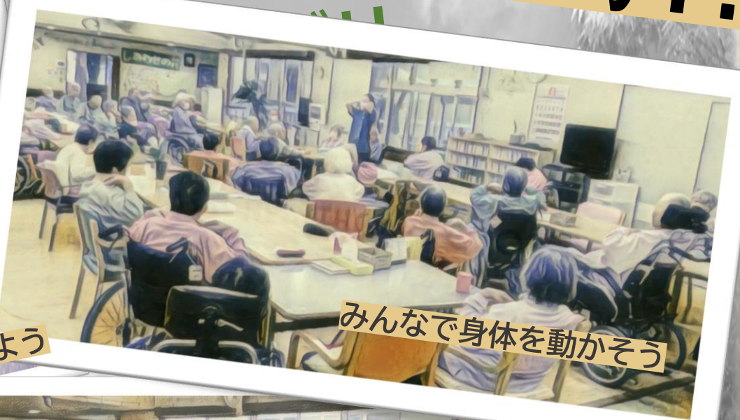
みんなで身体を動かそう